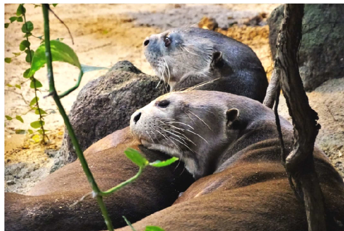
Maku und Amana